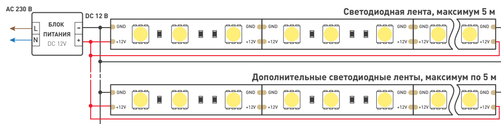
Схема 1. Подключение нескольких светодиодных лент с двух сторон