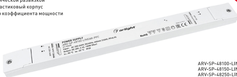
ARV-SP-48100-LINEAR-PFC ARV-SP-48150-LINEAR-PFC ARV-SP-48250-LINEAR-PFC